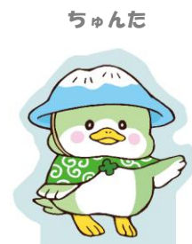
金城大短期大学部 美術学科学生 作品