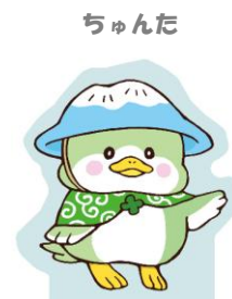
金城大短期大学部 美術学科学生 作品