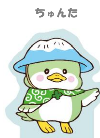
金城大短期大学部 美術学科学生 作品